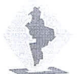
Representante del Partido VIDA NL